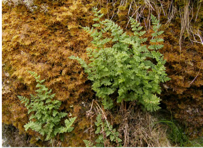
▲ Kalkkihaurasloikon, Cystopteris fragilis subsp. dickieana , suomalainen kanta muistuttaa päällisin puolin enemmän kiviyrtejä, Woodsia , kuin lajin nimirotu kalliohaurasloikko, C. fragilis subsp. fragilis .

La Gomera, Camino Forestal de La Meseta, 700 m, 11.4.2007 L. Helynranta