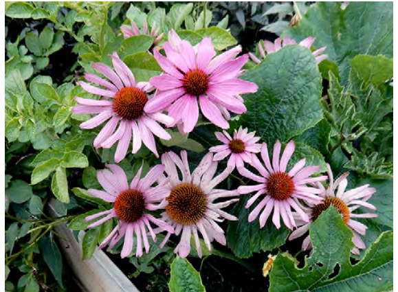
▲ Kaunopunahatun, Echinacea purpurea , mykeröitä kesäkukka- ja ravintokasvikaukalossa perunan ja kurpitsan lehtien ympäröimänä.

V. Lohja, Moisionhaka NE-puoli, Suintiantien (116) SW-puolen maankaatopaikka (6686046:3340397). 2 yksilöä risiin seurassa, 23.9.2019 Timo Hietanen 5619 (H).