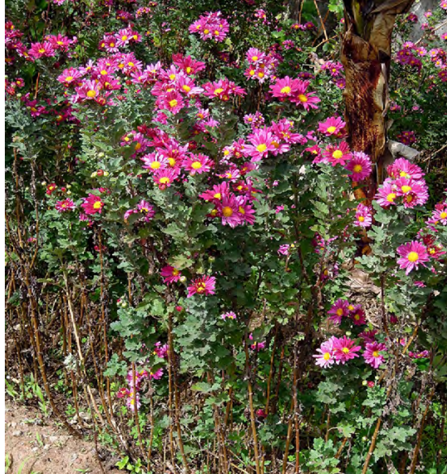
▲ Tarhakrysanteemi , Chrysanthemum morifolium , on risteymäsyntyinen koristekasvi, josta viljellään tolkutonta joukkoa erilaisia lajikkeita, toiset melko yksinkertaisia, toiset konstikkaita.